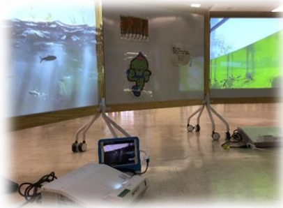
校舎内に ミニ博物館を再現『びわこタイム』

治療や身体的な制限に応じ、ICTの活用に取り組むことで、体験的な活動を補うこと、児童生徒自身の主体的な学びを促すことに努めています。