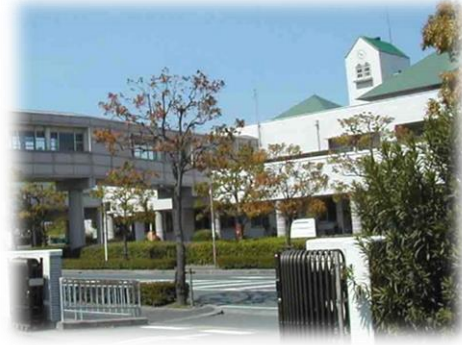
病院と校舎を結ぶ陸橋『ほほえみの橋』