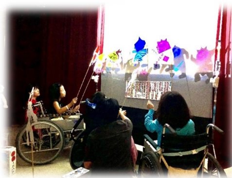
文化祭 小学部影絵劇 「じごくのそうべえ」

小学生と中学生と一緒に学んでいる環境を活かして、学部・学年を超えた取組(運動会、文化祭、学習交流会等)を行う中で、自主性、社会性、仲間と協働する力を育むよう努めています。