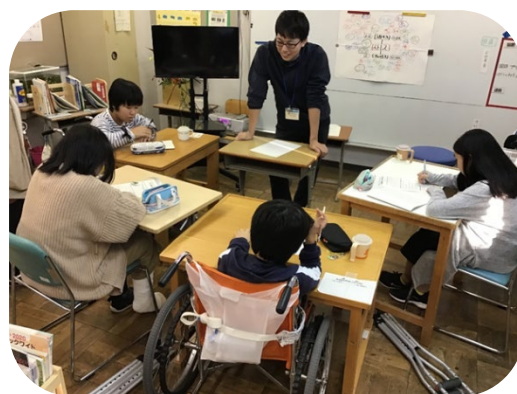
中学部自立活動「ストレスについて」

児童生徒が、治療中も安心して学習に取り組めるよう、病院・家庭・原籍校等と適切に連携を図りながら、児童生徒一人ひとりの病状や能力・適性等に応じた教育を行っています。個々の安静度や体調に応じて、教材・教具や学習形態を工夫しています。文部科学省のGIGAスクール構想に伴うICT環境整備も完了し、病弱特別支援学校における児童生徒の自主的な学習活動をめざし、インターネット等通信ネットワークの活用や、タブレット等の情報機器活用研究も推進しています。