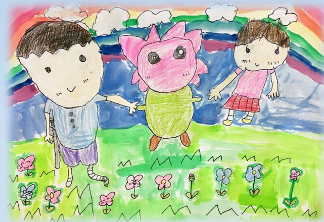
守山養護学校キャラクター『もりやん』